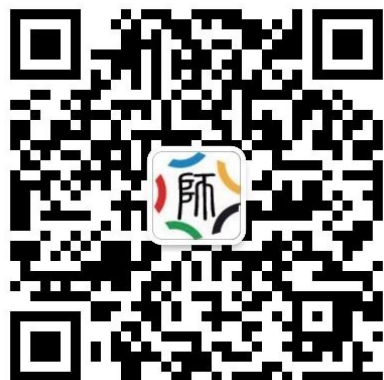
高校教师网络培训中心

教师也可通过全国高校网培中心微信公众号进入本校教师发展在线学习平台进行学习。在微信中搜索【高校教师网络培训中心】或者扫描下方二维码关注网培中心公众号，进入点击下方【学习中心】按钮，选择【校级平台】，输入在电脑端注册的用户名密码即可登入所属学校教师在线学习中心平台，进行课程学习。为保证平台学习效果，请学校教师最好使用电脑进行平台课程的学习。